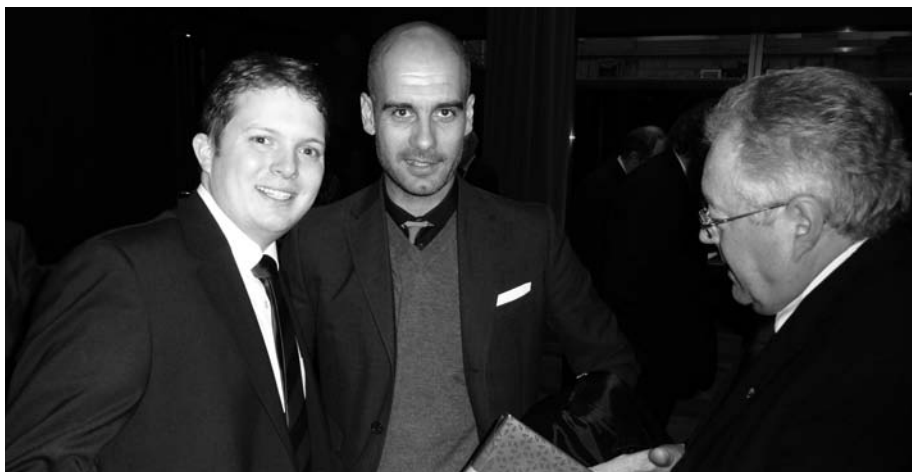
Pedro und Marco mit Barcelona-Trainer Pep Guardiola